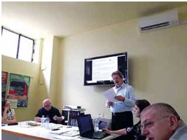
Assemblea di bilancio 2018

Un ringraziamento sentito infine ai Soci per l'attaccamento alla Cooperativa e per la fiducia che ci confermano costantemente.