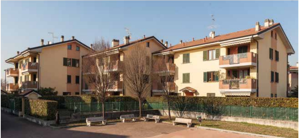
Residenza "La Fornace", Via Guido Rossa