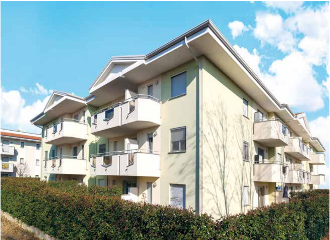
Residenza Alessandro Scotti Via Papa Giovanni XXIII, 18