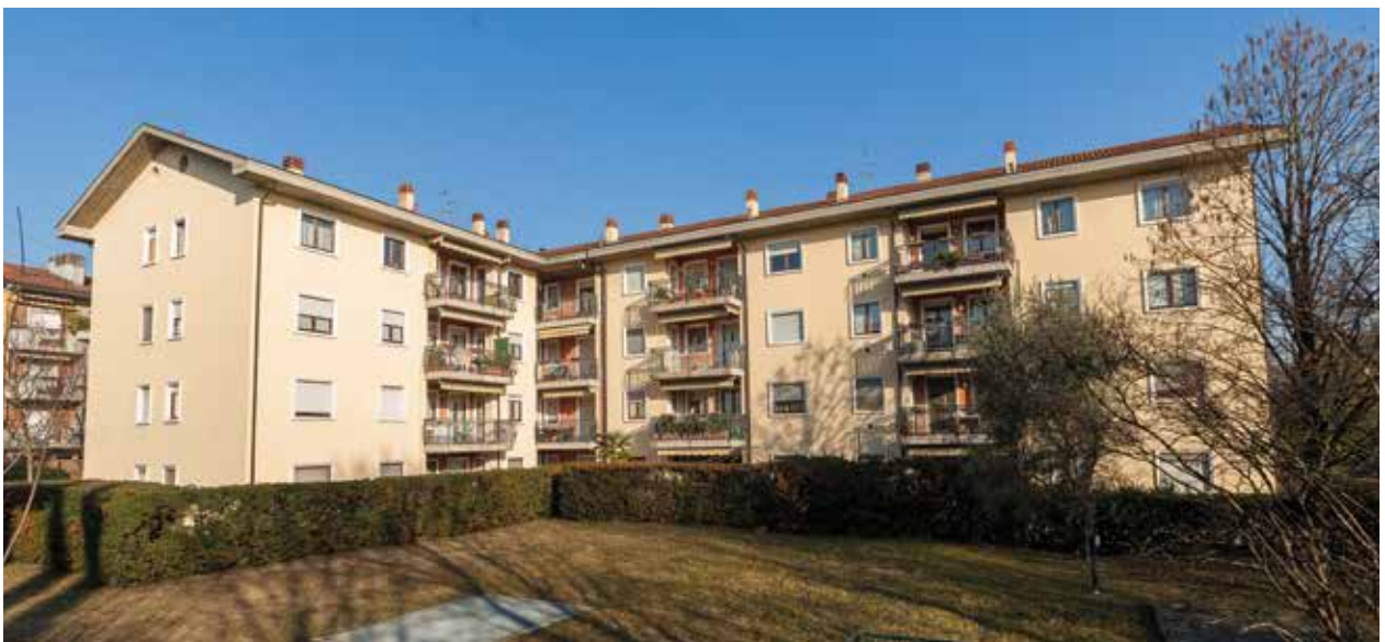
Residenza "L'ulivo", Via Silvio Pellico