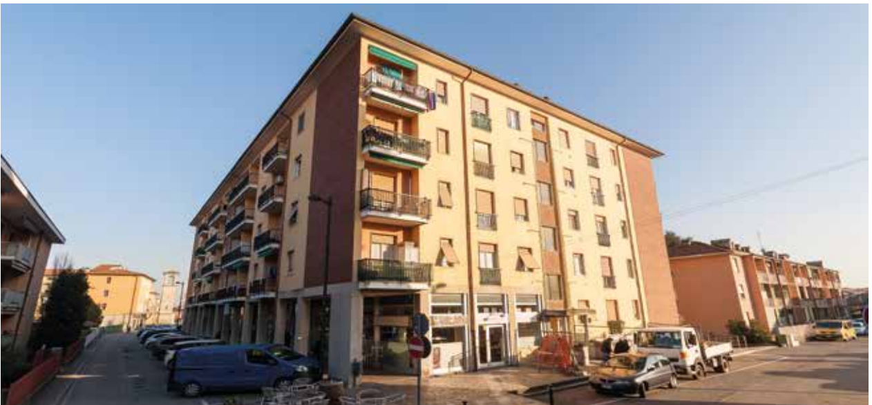
Condominio "La Proletaria", Via Michelangelo/Giotto